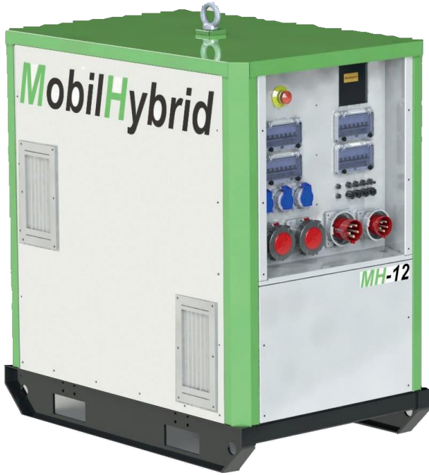
MobilHybrid Tip MH-12 12kVA

MobilHybrid , dizel jeneratör ile elektrik tüketim mevkii arasında konumlanır. MobilHybrid kullanım ihtiyacınızı güçlü şekilde destekler. Akülerinin şarj ihtiyacı olduğunda jeneratörü kontrol eder. Elektrik akülerden tedarik edilmeye başlayınca ses ve emisyon olmayacaktır.